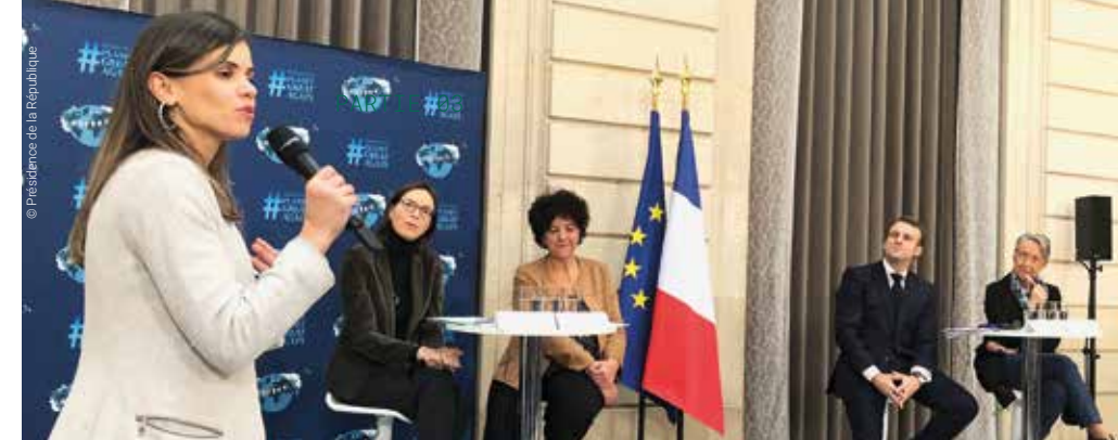
↑ Make our planet great again , 12 décembre, à l'Élysée, en présence du Président de la République et des ministres Brune Poirson, Frédérique Vidal, Elisabeth Borne.