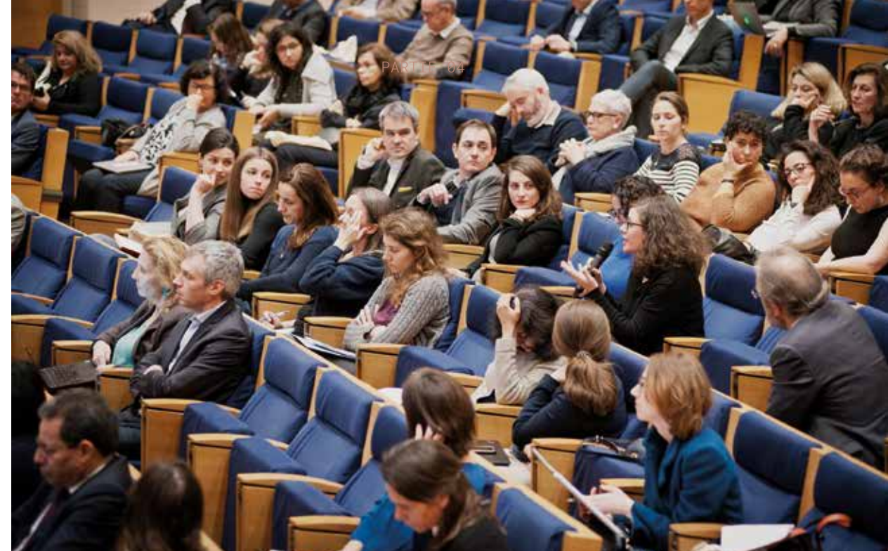
↑ Forum Campus France, 16 décembre, Collège de France, Paris.