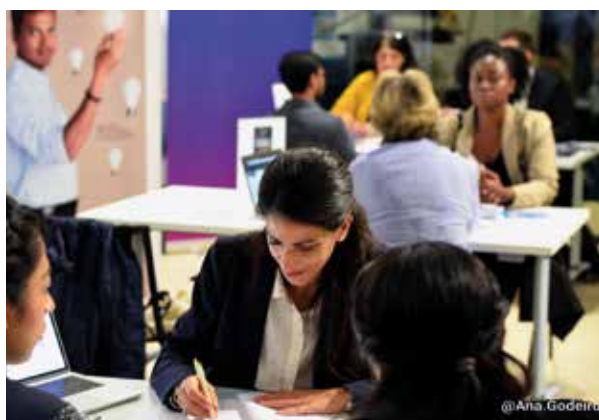
↑ La Soirée networking, 14 octobre, à Paris.

La 9 e édition du Forum emploi de France Alumni Chine s'est déroulée dans six villes (Canton, Chengdu, Pékin, Shanghai, Shenyang et Wuhan) au même moment. 100 entreprises françaises, chinoises et internationales ont participé et l'événement a attiré plus de 1 500 candidats .