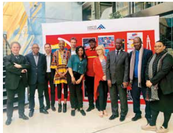
↑ Comité de suivi du programme de bourses malien, 19 avril.