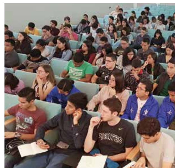
↓ Accueil des étudiants du programme MEXFITEC.

• En Uruguay : pas de nouvelle promotion de boursiers en 2019. Il reste néanmoins 11 étudiants actuellement en France, toujours suivis par Campus France.