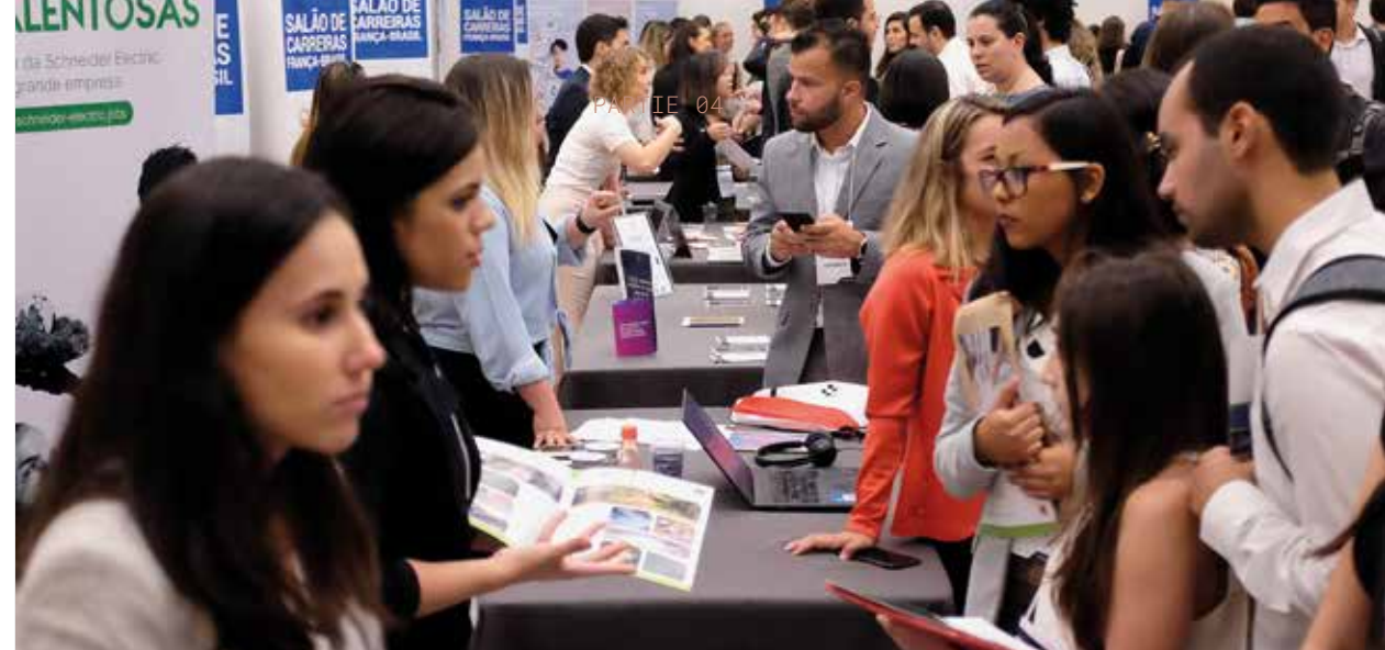
↑ Salon Carrières, Sao Paulo, Brésil, 12 novembre.

Une quarantaine d'alumni et d'entreprises ont participé au lancement de France Alumni Burundi en juillet, lors d'une soirée conviviale, en présence de l'Ambassadeur de France.