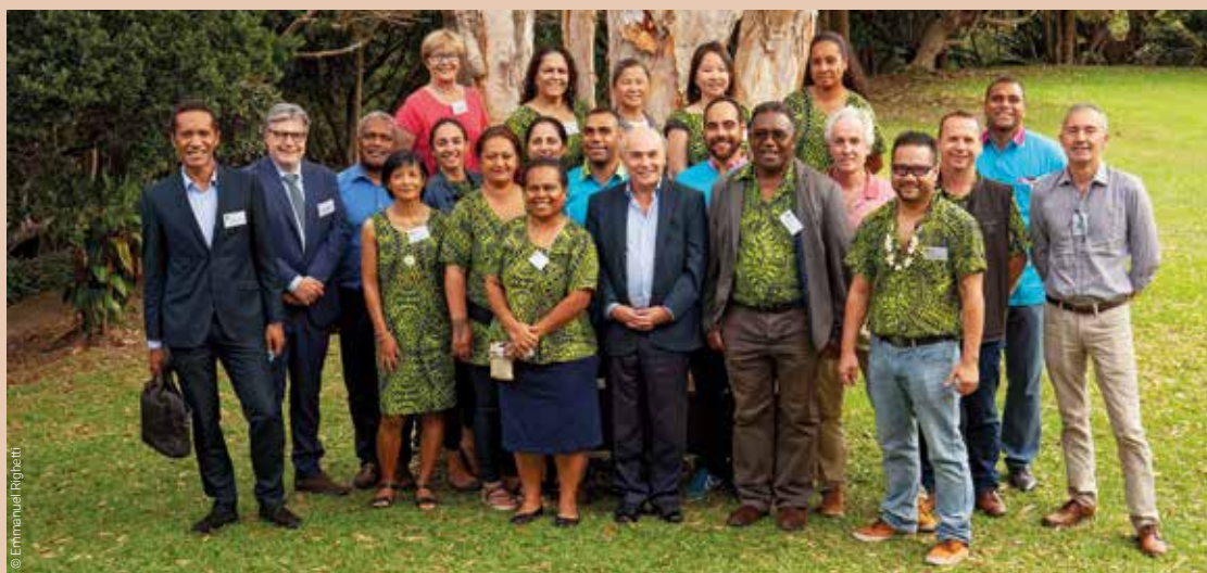
↑ Célébration des 30 ans du programme Cadres Avenir.