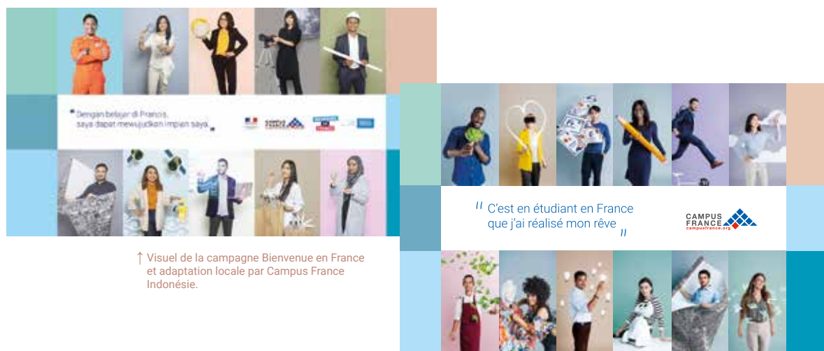
↑ Visuel de la campagne Bienvenue en France et adaptation locale par Campus France Indonésie.

La question des droits d'inscription différenciés, de l'accueil, ou de l'appropriation de la campagne de communication a fait apparaître un besoin fort en terme d'information. Pour répondre à ce besoin, près de 50 webinaires ont été organisés par l'agence permettant ainsi aux Espaces de relayer les informations et de mettre en place des actions adaptées.