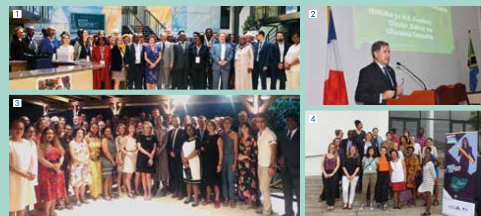
↑ 1. Journée Kenya, photo de famille de nos participants • 2. Tanzanie, ouverture salon • 3. Cap sur l'Océan Indien, partenaires mauriciens et français réunis à la résidence de France • 4. Nigéria - la délégation française participante

11 grandes manifestations 147 établissements français (dont 1/4 d'universités) 17 700 participants (étudiants, élèves, parents) 2 missions de prospection