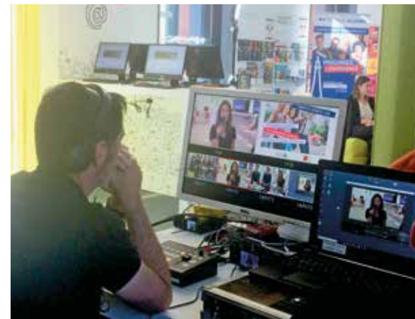
↑ Facebook Live dédié aux étudiants internationaux en partance pour Toulouse et sa région.

Environ 3 000 étudiants du monde entier ont visionné l'émission et ont pu obtenir des informations locales sur l'hébergement, les titres de séjour, la santé, l'offre d'apprentissage en français ou les loisirs.