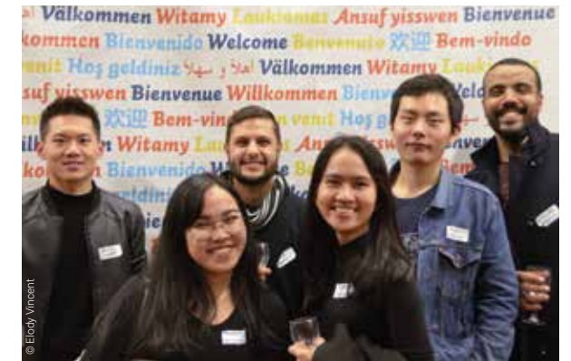
↑ Soirée du Student Welcome Desk de Lyon.

Les actions d'accueil se multiplient en région dans le but de compléter, d'enrichir ou de mutualiser l'offre proposée aux étudiants par les partenaires de la mobilité (établissements, associations, institutions territoriales). Le principe partenarial de ces actions se décline dans toutes les grandes villes sous différents formats (collaboration aux guichets uniques d'accueil, aux Nuits des Étudiants du Monde...).