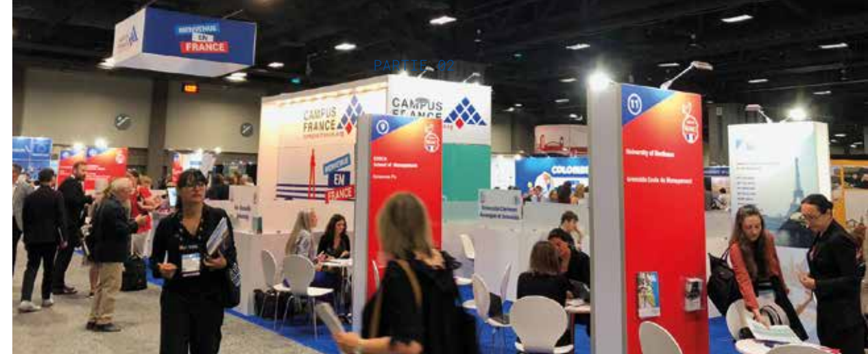
↑ Pavillon France, NAFAA, Mai, Washington, États-Unis.