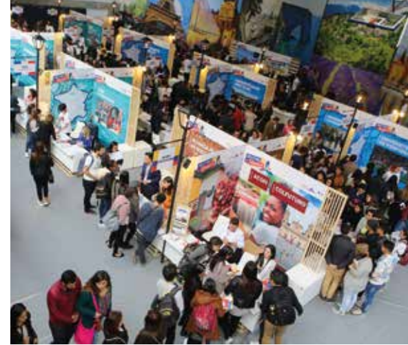
↑ Salon Destino Francia, Colombie, 19 et 20 octobre.

Les 2 e Rencontres universitaires franco-palestiniennes, 18 et 19 novembre : 20 établissements d'enseignement supérieur français et institutions ; 14 établissements d'enseignement supérieur et institutions palestiniennes.