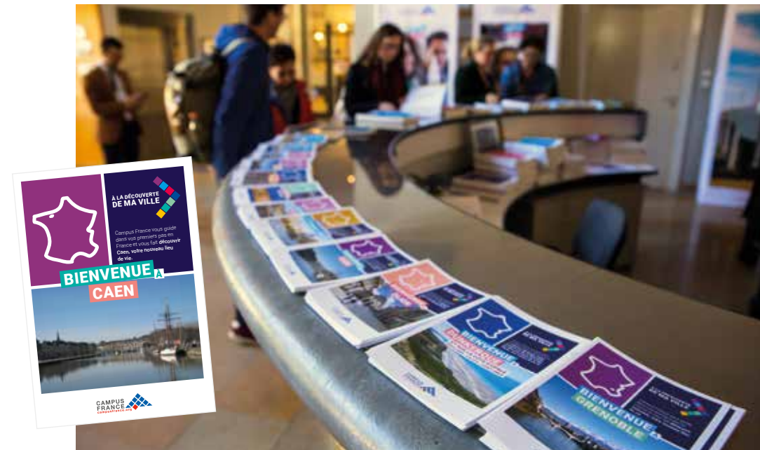
↑ La nouvelle collection des fiches villes présentée à l'occasion du Colloque de l'Accueil des étudiants internationaux, mai, Strasbourg.