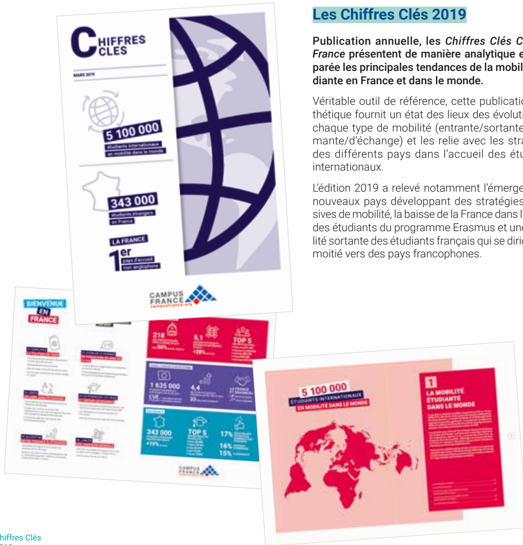
↑ Chiffres Clés 2019

L'édition 2019 a relevé notamment l'émergence de nouveaux pays développant des stratégies offensives de mobilité, la baisse de la France dans l'accueil des étudiants du programme Erasmus et une mobilité sortante des étudiants français qui se dirige pour moitié vers des pays francophones.