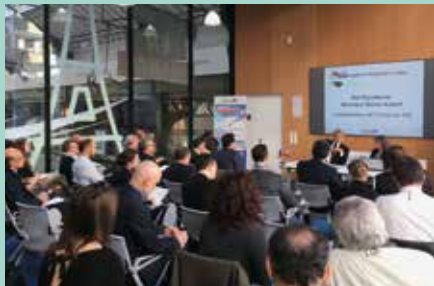
↓ Café-croissant Irak, 26 février.