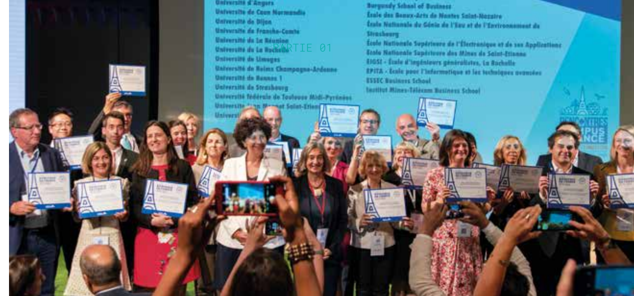
↑ Frédérique Vidal avec les premiers établissements ayant reçu le Label Bienvenue en France, Rencontres de la Recherche et de l'Innovation, juillet 2019, Cité des Sciences et de l'Industrie, Paris.