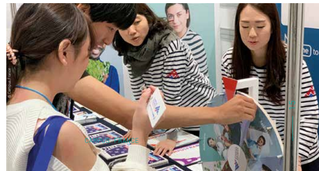
↓ Lancement de la campagne Bienvenue en France en Corée, lors du Salon Study in Europe le 2 novembre 2019 à Séoul.

Ces lancements réunissent partenaires institutionnels et académiques, étudiants et alumni. Ils permettent de créer un moment de communication autour de la France, repris par la presse et par les réseaux sociaux, et d'amorcer un processus d'animation prévu pour durer tout au long de l'année 2020.