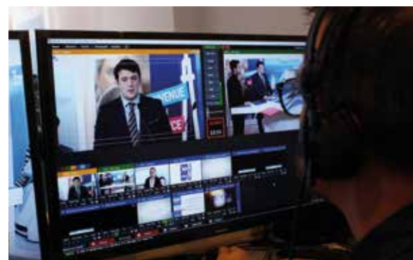
↑ Régie du nouveau studio Campus France.

Pour les sites locaux (propres à chaque pays), on observe en revanche une baisse générale de la fréquentation (-25 %). Cette baisse est plus marquée pour le continent africain qui représente habituellement 70 % des visites sur les sites locaux et qui enregistre cette année -34 % de visites. Les sites des pays du Proche et du Moyen-Orient voient au contraire leur fréquentation augmenter (+30 %).