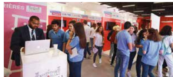
↑ Salon Destination France, au Liban, 17 octobre.

* En raison des mouvements de contestation politique au Liban, une seule journée de Salon a pu avoir lieu.