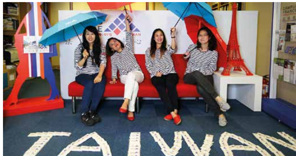
↓ Espace Campus France à Taiwan.