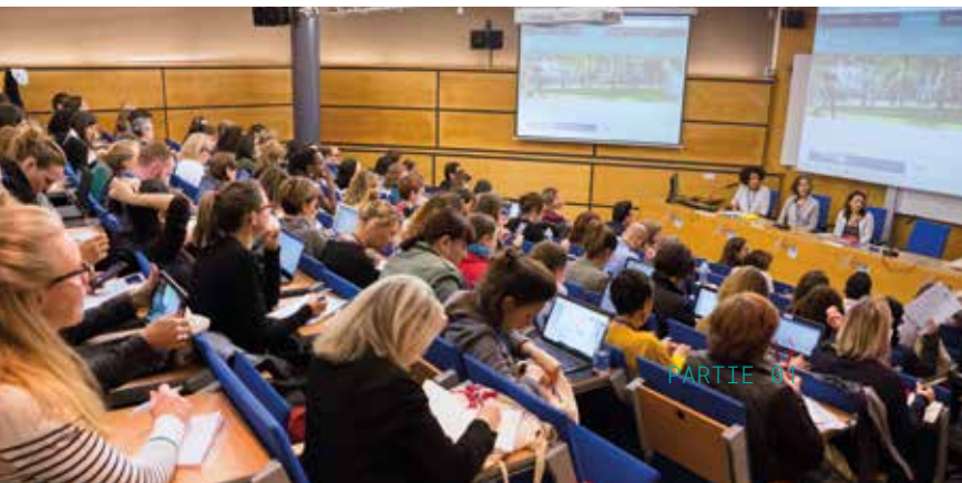
← Colloque de l'accueil des étudiants internationaux, mai, Strasbourg.

Faisant suite à ces ateliers, à la demande des établissements présents, la création d'un réseau des personnes en charge de l'accueil dans les établissements d'enseignement supérieur a été envisagé afin de poursuivre les échanges tout au long de l'année.