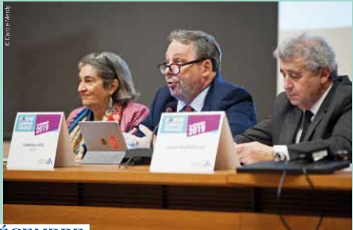
16 DÉCEMBRE FORUM CAMPUS FRANCE (Collège de France, Paris)