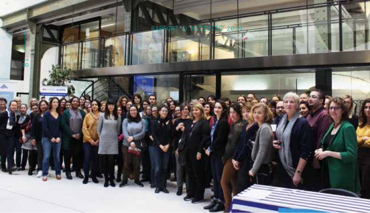
↑ Réunion du réseau des acteurs de l'accueil des étudiants internationaux, novembre 2019.