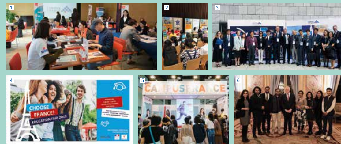
↑ 1. Manifestation China Education Expo, salon étudiants, octobre 2019 • 2. EHEF Japon Fair, salon étudiants, mai 2019 • 3. Délégation coréenne pendant les Rencontres de la Jeunesse et l'Innovation • 4. Visuel Choose France Sri Lanka, janvier 2019 • 5. Le salon EEF à Taiwan, octobre 2019 • 6. Le Club Young Leaders au Quai d'Orsay