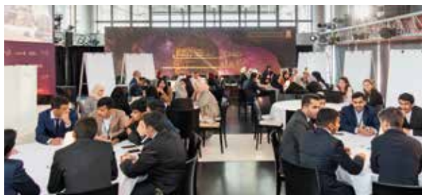
↑ Forum des étudiants du programme Al-Ula, Campus France, mars, Paris.

Le premier forum des étudiants du programme Al Ula, co-organisé par Campus France et l'Agence française de développement d'Al Ula pour le compte de la Royal Commission For Al-Ula s'est déroulé à Paris les 27 et 28 mars.