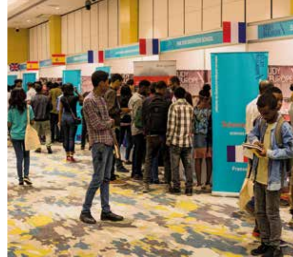
↑ Salon Study in Europe en Éthiopie.