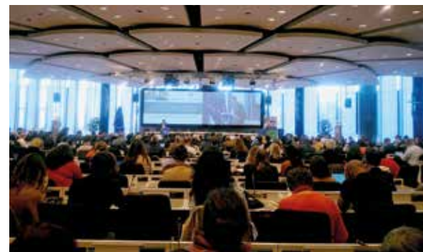
↑ Conférence Investing in people, by investing in higher education and skills in Africa , Commission européenne, Bruxelles.