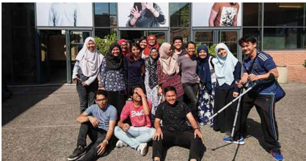
↑ Étudiants malaisiens du programme Malaisie, Cavilam, Vichy.