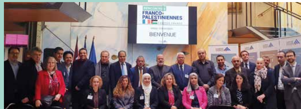
↑ Rencontres franc-palestiniennes, 18-19 novembre.