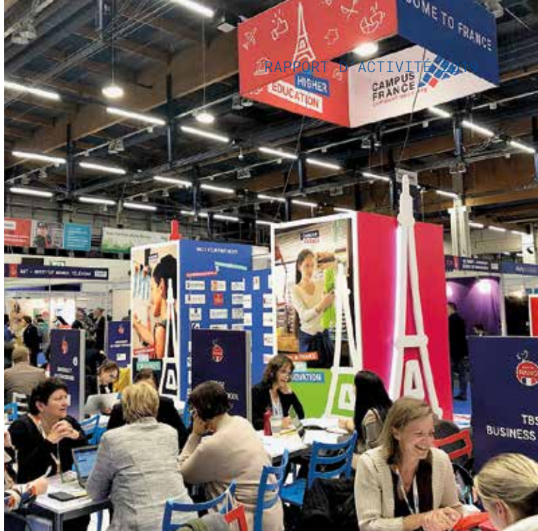
↑ EAIE Helsinki, 2019.