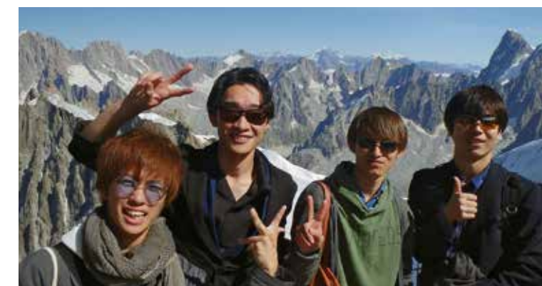
↑ Étudiants japonais du programme courts séjours.

En 2019, une trentaine d'universités japonaises ont confié à Campus France l'organisation pour 100 étudiants de deux sessions annuelles de séjour dans des centres FLE.