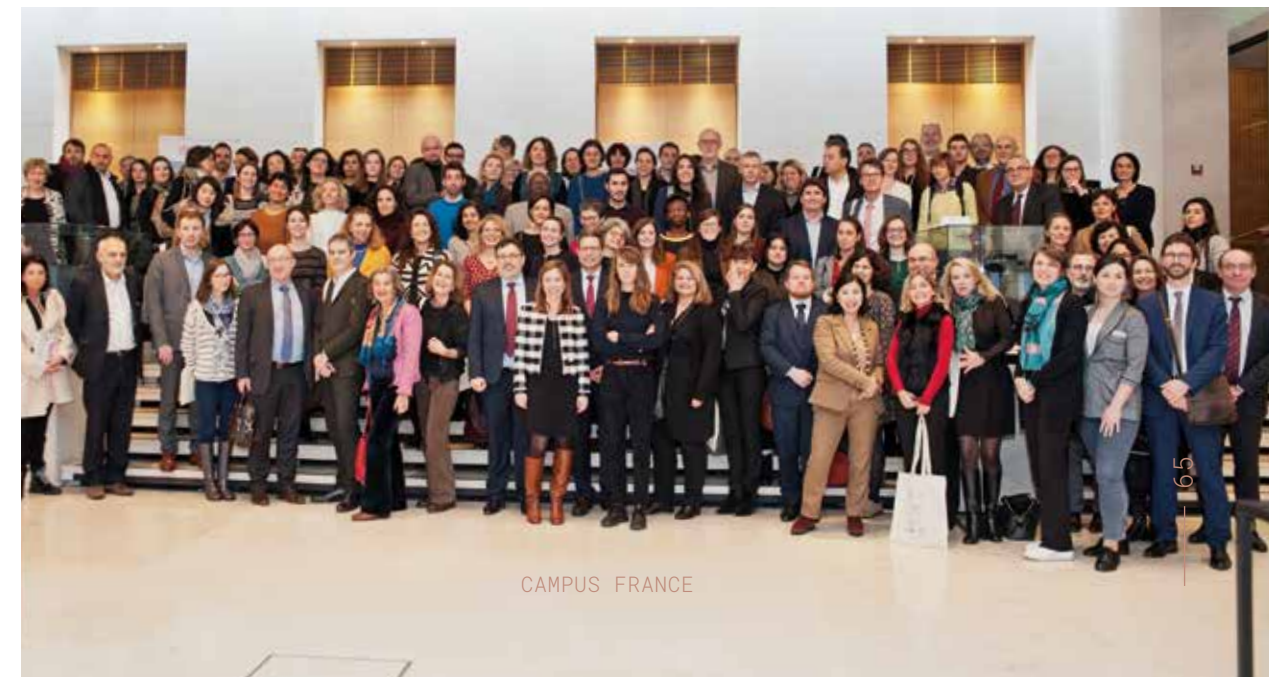
↓ Assemblée générale du Forum Campus France, 16 décembre.