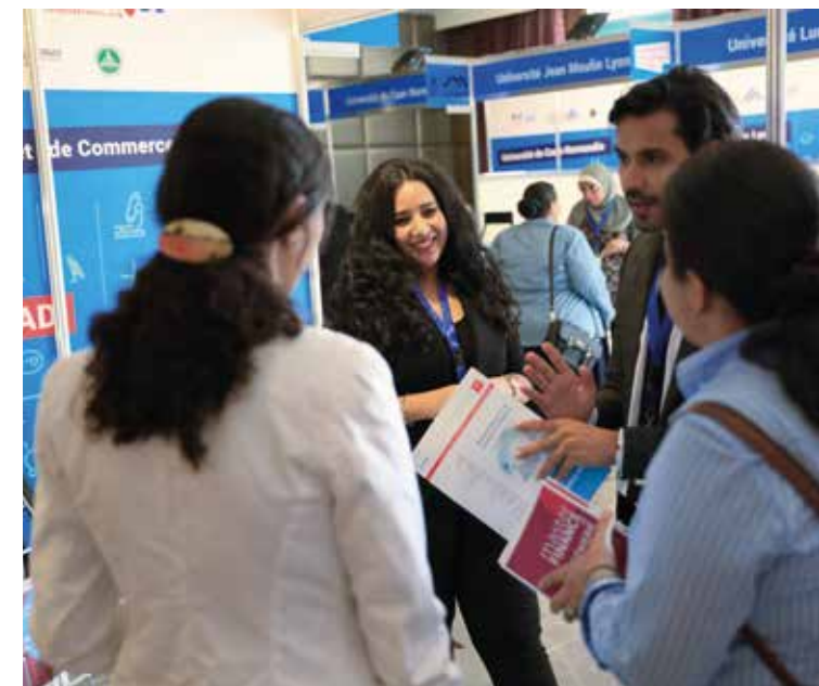
↑ Salon Choose France en Égypte, 20-21 octobre.

Ces dernières années, les liens entre la France et l'Égypte se sont fortement resserrés. La France a accueilli 2 590 étudiants égyptiens en 2017-2018, 4 e pays d'accueil des étudiants égyptiens elle occupe une place prépondérante en Égypte, notamment à travers l'implantation du Pôle universitaire francophone.