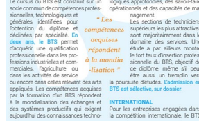
Le cursus du BTS est construit sur un socle commun de compétences professionnelles, technologiques et générales identifiées pour l'obtention du diplôme et spécialisées par spécialité. En deux ans, le BTS permet d'acquérir une qualification professionnelle dans les professions industrielles et commerciales, l'agriculture ou dans les activités de service ou encore dans celles relevant des arts appliqués. Les compétences acquises par la formation d'un BTS répondent à la mondialisation des échanges et des systèmes productifs qui exigent aujourd'hui des connaissances techno-

Plus de 240 000 étudiants sont inscrits dans les sections de techniciens supérieurs pour l'obtention du Brevet de Technicien Supérieur (BTS) proposé dans 88 spécialités. Dans tous les secteurs d'activité se développent des fonctions nouvelles d'encadrement technique associées au travail des ingénieurs, des chercheurs ou des cadres supérieurs administratifs, financiers ou commerciaux. Le diplôme national de Brevet de Technicien Supérieur répond à ces besoins en qualifications et compétences avec pour objectif une insertion professionnelle directe.