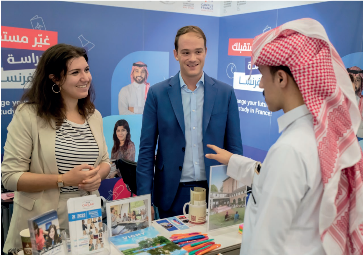
Pavillon France à l'International Conference and Exhibition for Education, Riyad, 2022.