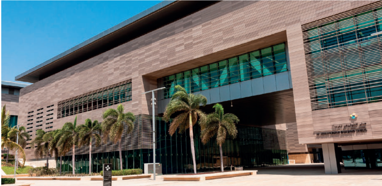
Université des sciences et technologies du roi Abdallah.

Trois acteurs centraux soutiennent et produisent la recherche du Royaume : la KACST, le bureau R&D (RDO) du ministère de l'Éducation, et les principales universités.