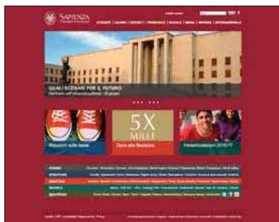
Université de La Sapienza de Rome

Les sites Internet des établissements étudiés se