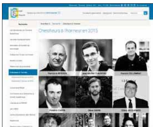
Rubrique « Chercheurs à l'honneur » - Université de Nice

La valorisation des prix Nobel ou Médailles Field obtenus progresse de plusieurs points, passant de 1 à 8 % entre 2010 et 2016. Mais ce sont surtout les autres distinctions qui sont nettement mieux mises en valeur. Plusieurs universités proposent d'ailleurs une rubrique spécifique, aux intitulés variables : « Chercheurs à l'honneur » à Nice ou « Classement et distinction » à Versailles. Cette catégorie regroupe une grande variété de distinctions : médailles du CNRS, enseignants retenus par l'Institut Universitaire de France (IUF), prix divers... et jusqu'à la remise des prix Honoris Causa à des personnalités étrangères.