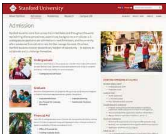
Rubrique « Admission » - Université de Stanford

> Université de Stanford . Site en anglais uniquement. L'onglet « Admission » détaille les étapes de l'inscription, avec un mode d'emploi proposé pour l'inscription en ligne et les dates limites d'inscription. Une section est consacrée à l'aide financière.