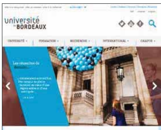
Menus d'accueil des universités d'Orléans et de Bordeaux