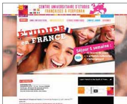
Centre universitaire d'études françaises à Perpignan