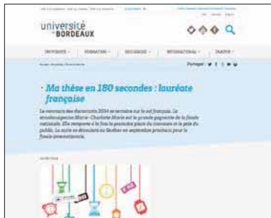
Thèse d'une étudiante lauréate en ligne - Université de Bordeaux

Plusieurs établissements n'hésitent pas à valoriser leur participation dans les différents appels à projets des investissements d'avenir (IDEX, Labex, Equipex...) initiés par le gouvernement à partir de 2010. Les projets lauréats sont souvent présentés dès la page d'accueil des universités (Bordeaux, Strasbourg, Lyon) et font parfois l'objet d'une rubrique dédiée (UPMC).