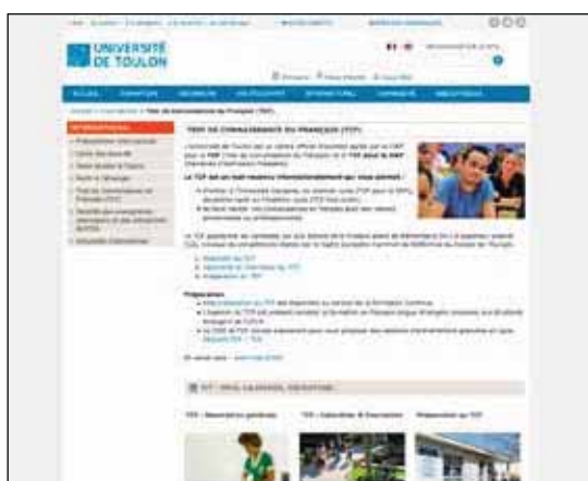
Test de connaissance du français en ligne - Université de Toulon

Plus de la moitié des établissements délivre une information sur le système de crédits européens, généralement sous la forme d'un schéma de l'organisation des diplômes sur le modèle Licence/Master/Doctorat. 1