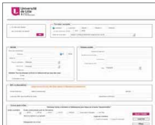
Fiche d'inscription en ligne - Université de Lille

Procédures d'inscriptions pour les pays membres de la convention CEF.