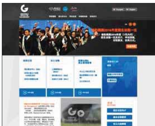
Site de l'École de Management de Grenoble en version chinoise

Comme pour les universités, on trouve aussi généralement des guides d'accueil téléchargeables ou, dans le cas de l'ESSEC, des brochures en anglais décrivant chaque programme d'études. Sup de co La Rochelle propose des brochures en anglais, espagnol, chinois.