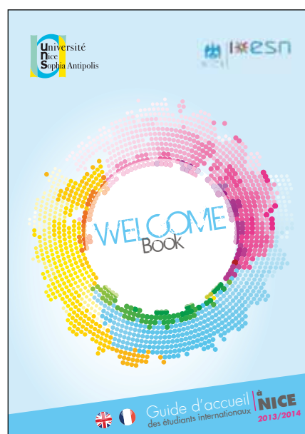
Guide d'accueil Welcome Book - Université de Nice

À signaler enfin que plusieurs établissements (Bretagne-Sud, Toulouse 2, Grenoble) proposent aussi des guides spécifiques à l'attention des chercheurs/doctorants, généralement rédigés en anglais.