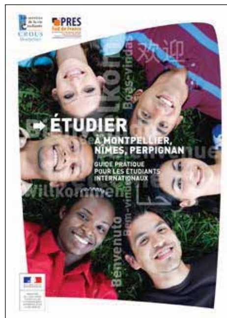
Guide d'accueil pour les étudiants internationaux - Universités Montpellier, Nîmes et Perpignan

En matière de préparation au séjour, d'importants progrès ont été fait pour l'accès à l'information. Les différentes sous-rubriques sont toutes en progression par rapport à l'enquête de 2010, et dans la grande majorité, mises à jour. Par rapport à la question du logement, abordée de façon quasi-systématique (90 %), celle concernant les bourses ou aides financières est en revanche moins généralisée (72 %). Le logement fait même parfois l'objet de guides spécifiques. Et il est à noter que ces éléments de préparation du séjour se retrouvent également très détaillés dans les guides d'accueil téléchargeables.